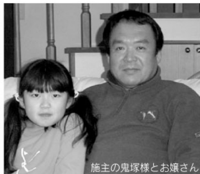
施主の鬼塚様とお嬢さん