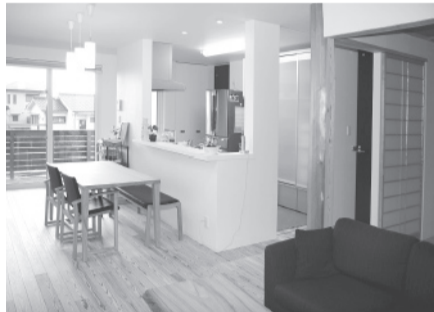
▲明るい日射しのダイニング、キッチン。

です。今日のように、どうしても寒いときにはエアコンも使用しますが、普通は、このストーブ一台で全館を暖房しています。二階には暖房器具がありません。とのお答え。お子様の声が聞こえますが大丈夫ですか、寒くないですか、蓄熱式ストーブは電気料、高いんじゃないですか?という質問に。