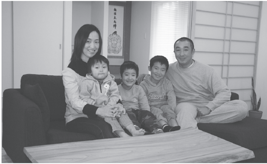
▲真冬でも、N邸の皆様は元気いっぱいでした。