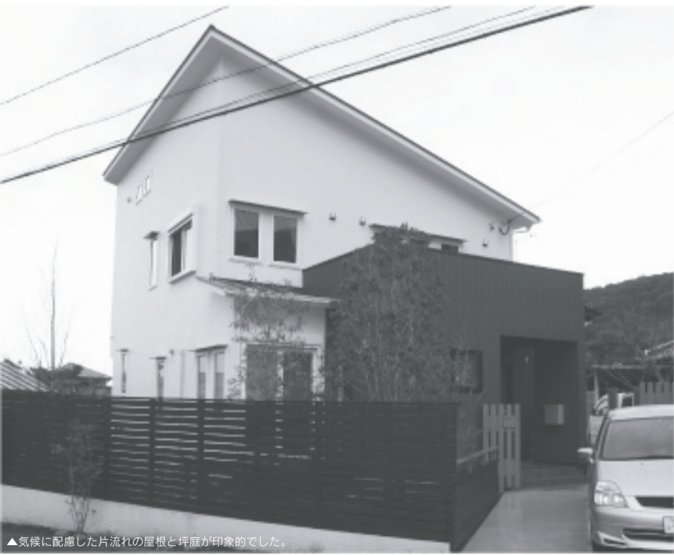
▲気候に配慮した片流れの屋根と坪庭が印象的でした。

N邸の皆様、ありがとうございました。ご家族皆様のご多幸を心から祈りしております。