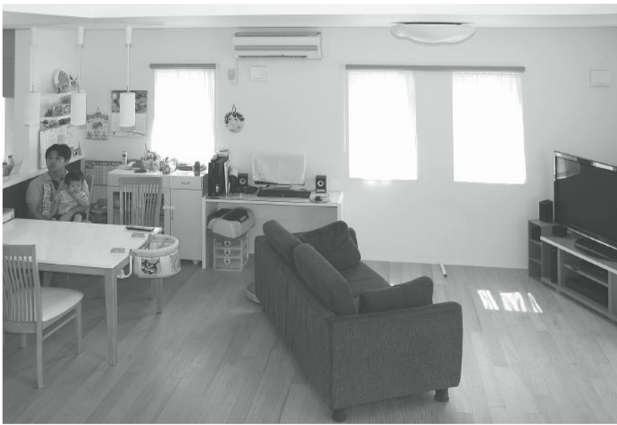
ムク板のリビングルーム

「予算的に無理かもしれないと思いましたが、話だけでも聞いてみようと言うことで会社に伺ったのですが、設計の方が懇切丁寧に話を聞いてくださって、素材的には、全く落とすことなく、一階二階共に床にはムク材が使われていますし、開口部にも遮熱ガラスの樹脂サッシを使用して予算内に納めて頂きました。普通はクローゼットなどは、主寝室に取り付けられるものですが、一階にまとめて頂き、非常