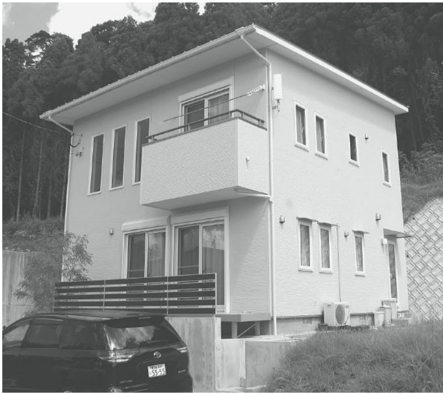
総2階建てのK邸の外観