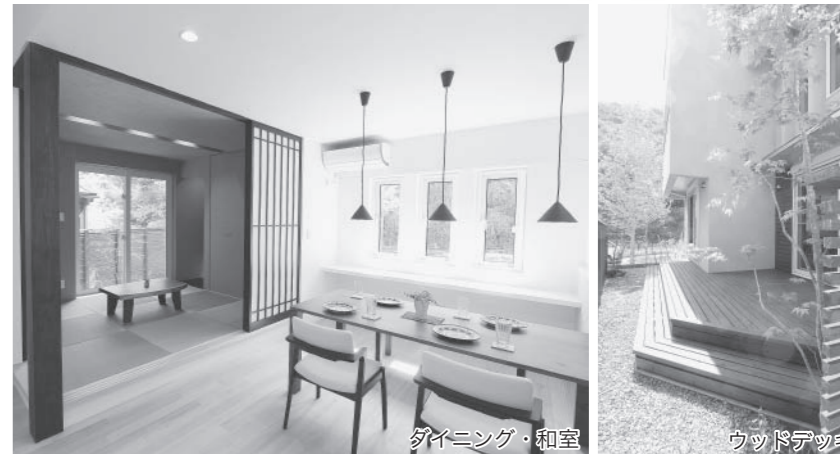
ダイニング・和室 ウッドデッキ