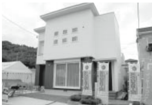
鹿児島県鹿児島市星ヶ峯6丁目30-6