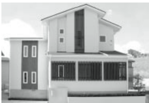
鹿児島市山田町字阿弥陀ヶ宇都1241-252