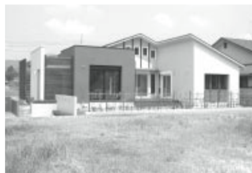
鹿児島県薩摩川内市天辰町字水流89-1